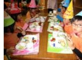
ローストチキンやツリーの形のポテトサラダ・・・おいしかったな～