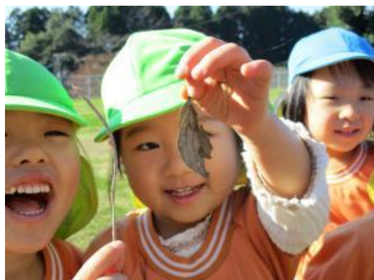
今年も元気いっぱいの笑顔