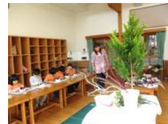
(12月22日 生花教室) ゴう組 5歳児 テーマは『クリスマス』かわいい作品が完成しました。