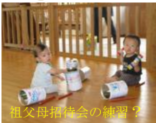
祖父母招待会の練習?

農道に不審者がいるという設定で訓練をしました。子ども達はおしゃべりをする事もなく、部屋、ホールへの移動ができました。