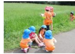
散歩「この花なんて言う名前？」

社会福祉法人こぼと福祉会 大塚原保育園 電話 0984-44-0700 IP電話 0984-44-0855