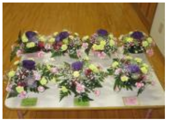
生花教室 第1回作品

入園・進級式から一ヶ月、子供たちは、園庭に出ると元気に走り、草花をみつけたり、近くの農道散歩の活動など毎日元気に過ごしています。少しずつ新しい環境にも慣れてきました。さわやかな風が吹く季節。5月はこどもの日の集会、バス遠足もあります。子どもたちが毎日楽しみに保育園に登園して、元気いっぱい活動出来るようにしたいと思います。