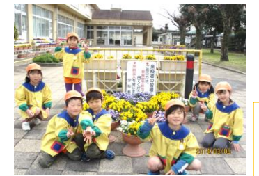
小学校の校門前『もうすぐ1年生』