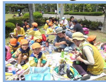
お弁当おいしかったですね。