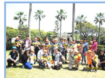
(動物園で記念撮影)

火事の想定で第1避難場所の園庭に避 難しました。ヘルメット、防災頭巾をかぶり 速やかに避難できました。