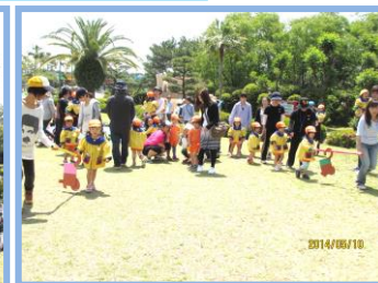
(クラスごとにゲームをしました。)