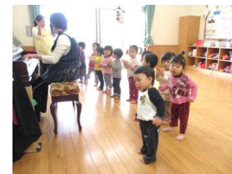
新しいクラスで朝の会