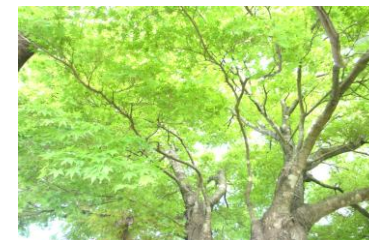
保育園のもみじの木

入園・進級式から一ヶ月、子供たちは少しずつ新しい環境に慣れてきています。晴れた日は散歩に出かけ、園庭では「こいのぼりだ」と手を伸ばしながら楽しく遊んでいます。さわやかな風が吹く季節。5月も子どもたちが毎日を楽しみに保育園に登園して元気いっぱい遊べるようにしたいと思います。