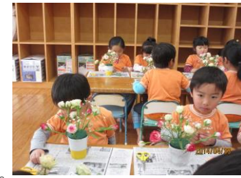
(生花教室) 4/23 今年の年長組さんは初めての生花教室でした。