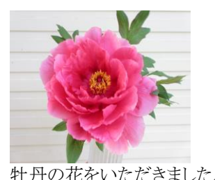
牡丹の花をいただきました。